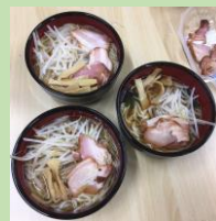
昼食、おやつは子どもたちと一緒に作ります