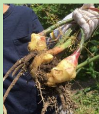
畑体験もできます！

★平日ビジターコース★ 1時間：1,000円（昼食、おやつ代は別途要） 1日：3,000円（昼食、おやつ代込み）