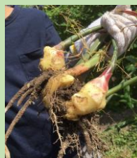
畑体験もできます！