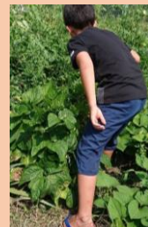
畑で虫取りに夢中