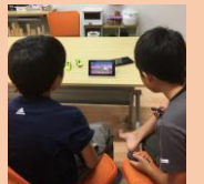
雨の日はゲーム対戦