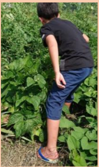
畑で虫取りに夢中