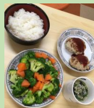
昼食、おやつは子どもたちと一緒に作ります

*経済的に料金の全額負担が厳しいご家庭におかれましては、一部を補助させていただきます（1,000円/日/人）。一度ご相談ください。